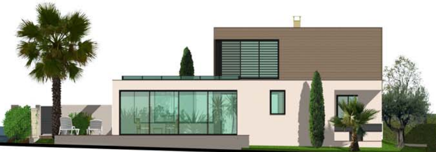
Façade Sud Est

GSM : 06 29 577 042 - Email : jacques.gille@sfr.fr