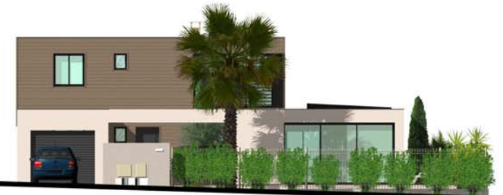
Façade Sud Ouest