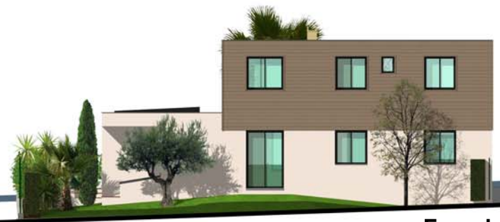
Façade Nord Est