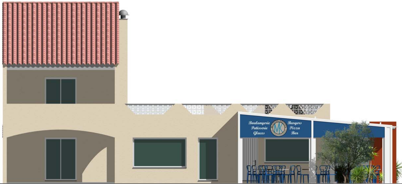
Façade Nord Ouest

Jacques GILLE Architecte D.P.L.G. Ordre des Architectes A17862 39 chemin du Carreyrou - 34350 VALRAS PLAGES GSM : 06 29 577 042 - Email : jacques.gille@sfr.fr Site Web : www.igarchi.fr