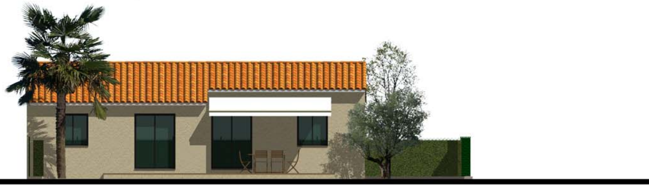
Façade Sud Ouest