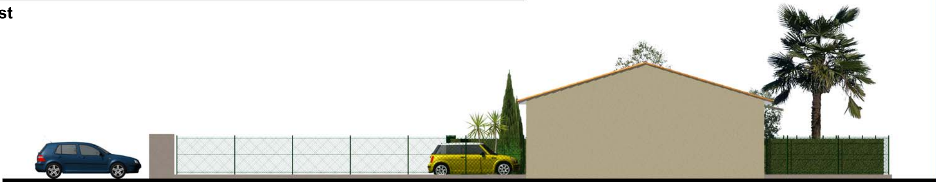
Façade Nord Ouest