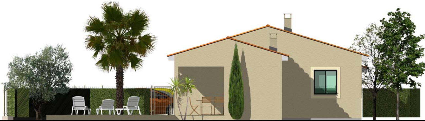
Façade Nord Est

34230 Saint Pons de Mauchiens GSM : 06 17 98 09 08