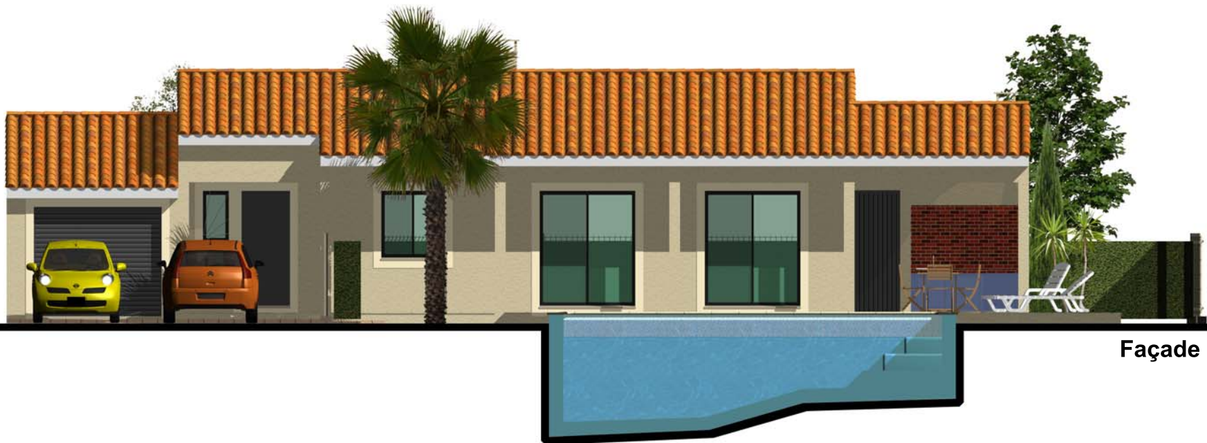
Façade Sud Est